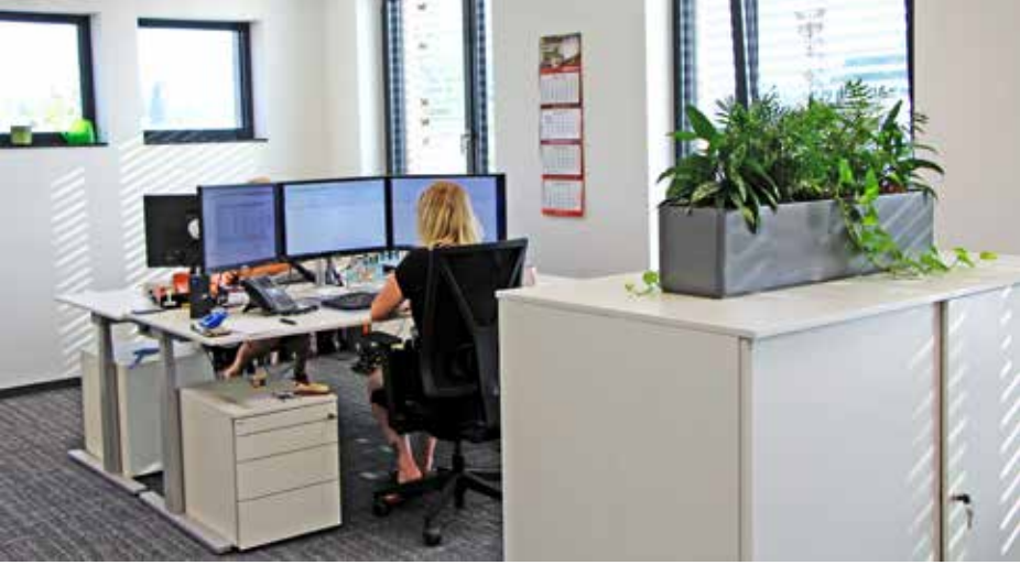
Modern ausgestattete, helle Büroräume bietet das Gebäude nicht nur, wie hier, dem PARTA-Personal.