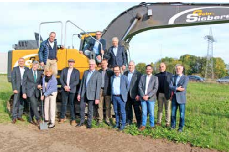
Vom Spatenstich Ende Oktober 2022 bis zum Einzug der ersten Mitarbeiter vergingen nur die geplanten 16 Monate Bauzeit.

auch im Vertretungsfall bei Urlaub oder Krankheit die fachliche Betreuung unserer Mitglieder immer gewährleistet.“